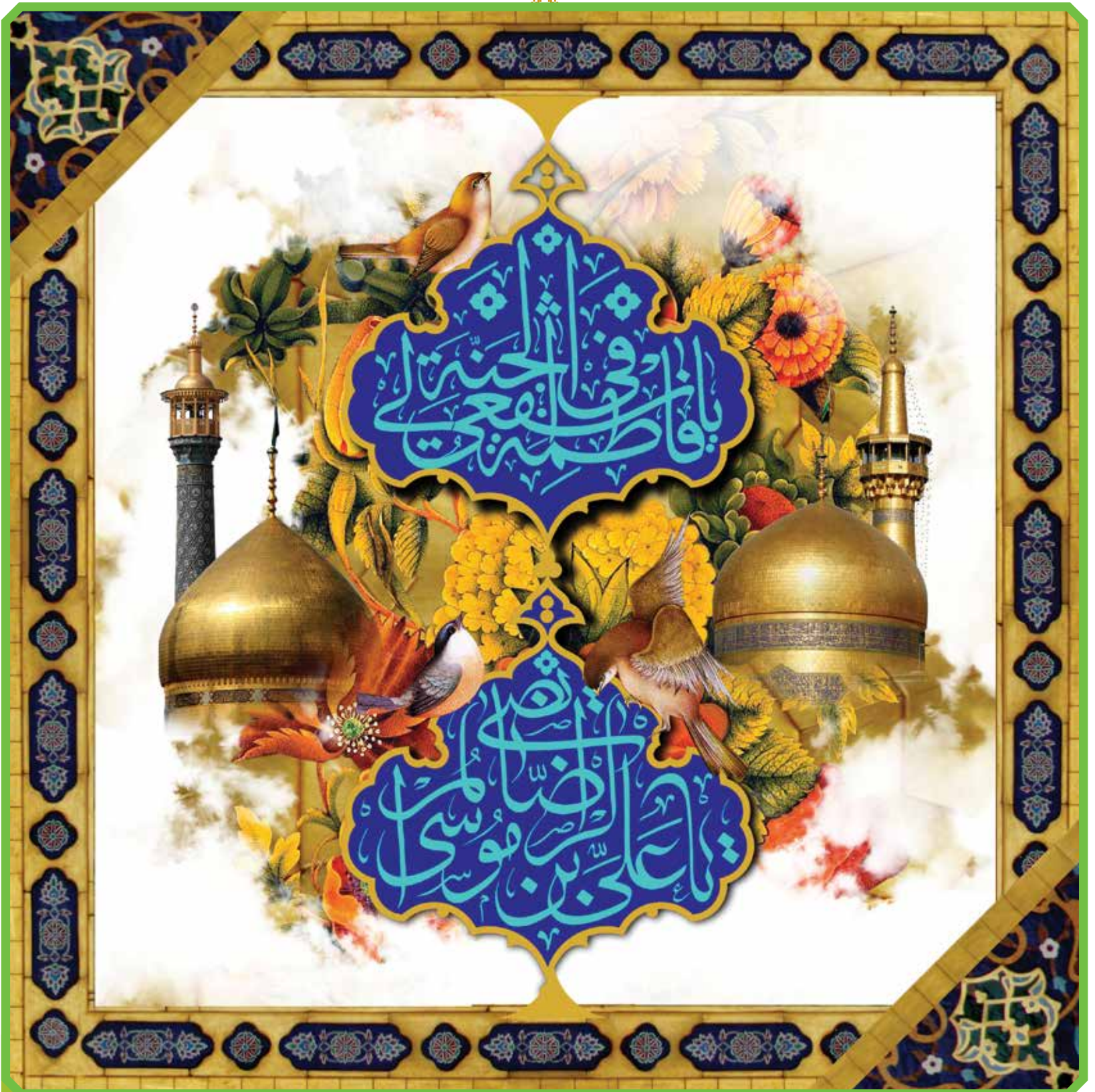
طرح: رضایی زاده

امام رضا علیه السلام : عدالت ورزی و نیکوکاری، عامل پایداری نعمت هاست.